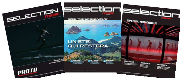
Sélections – maquette 2009